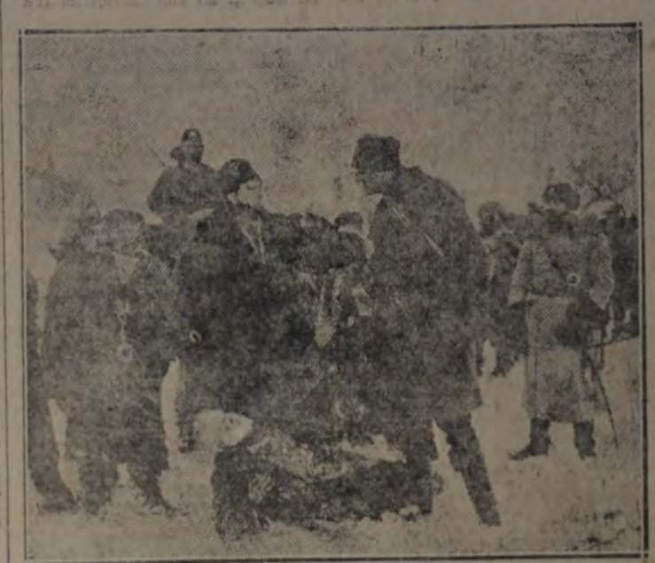
Una escena de "Resurrección", famosa obra de Tolstoy adaptada a la pantalla por su hijo Ilya. Se estrenará hoy domingo 15 en el Programa de Artistas Unidos.

RESURRECCION Representa, el grabado que publicamos, una escena de la interesante película, producción de "Artistas Unidos", cuyo estreno en las principales salas tendrá lugar hoy 15 de mayo.