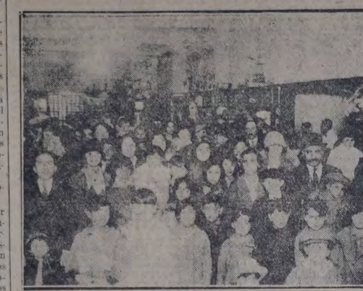
En el salón central de ventas de "El Hogar Obrero", durante la distribución de juguetes a los pequeños visitantes.

El Centro Socialista Femenino, quiso asociarse al hermoso acontecimiento