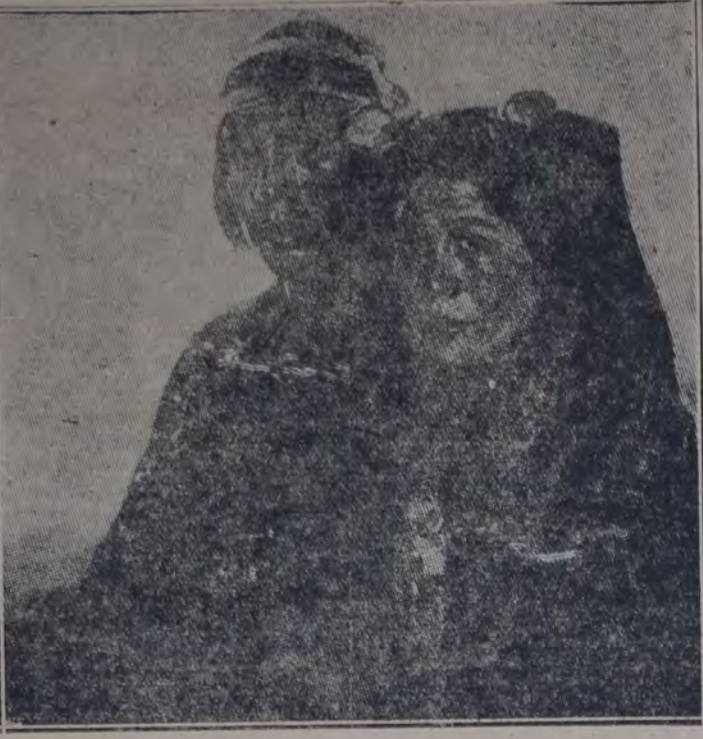
"CUZQUEÑOS" de Emilio Centurión

A media tarde, de aquella calurosa jornada, sentimos a lo lejos unos ladridos, que yo atribuí — alborozado — a la proximidad de alguna población. Iba a comentar tal líta con mi acompañante que, como siempre, tranquilaba a mi lado, cuando lo vi palidecer mortal-